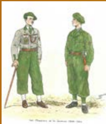
LES CHANTIERS DE LA JEUNESSE 1940 - 1944