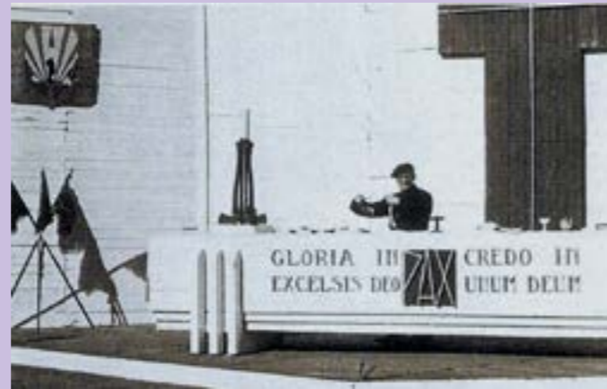
Messe aux Chantiers.

En 1940, aux Chantiers de Jeunesse on recherchait justement des aumôniers. Il se porta alors volontaire et fut muté dans le Gard au Groupement 45 Saumur où il fut très apprécié. Il est décédé le 11/04/1991 à Bayonne.