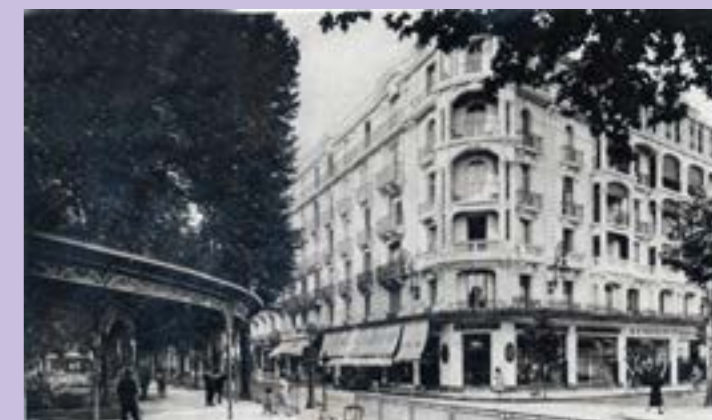
Hôtel du Parc

Tout d'abord, Vichy, ville thermale très connue au niveau international, avait une grande capacité d'accueil avec ses hôtels, ses 10 palaces et ses nombreuses villas. 150 000 personnes pouvaient ainsi y être logées.