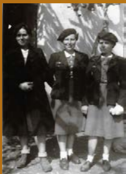
Sainte Livrade Les infirmières (1942)

Dernière page Affiche du Groupement 6 pour spectacle "Les Aliscans"