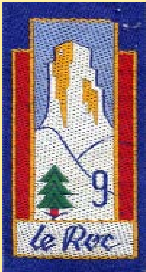
Insigne du Groupement 9

Passe au Service de la Production Industrielle à partir du 1er février 1944.