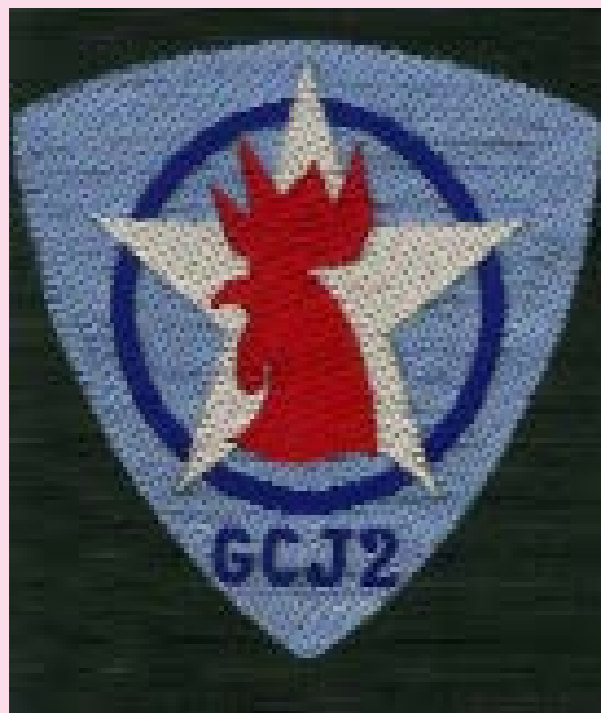
Insigne du Gt 2

La chaîne de télévision France 3 a retransmis le 6 février dernier un film d'environ 5 minutes sur le Groupement 2 Franche-Comté Jehan de Vienne qui se trouvait à Crotenay (Jura).