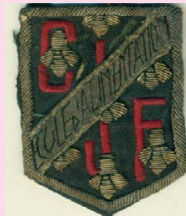
Insigne de l'Ecole d'alimentation

Chantiers de Jeunesse), un record est tombé.