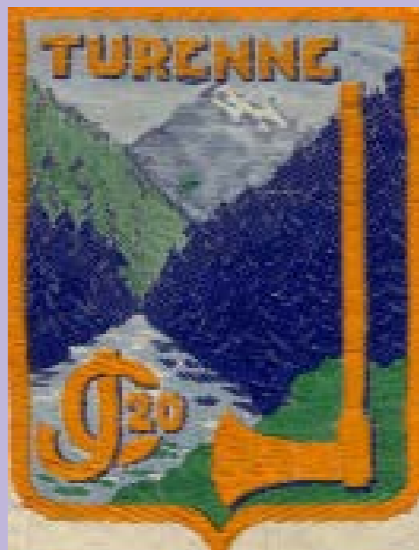
Insigne du Gt 20

L'insigne dont vous parlez représente un cours d'eau, la Luzège, et une montagne appelée Frétigne.