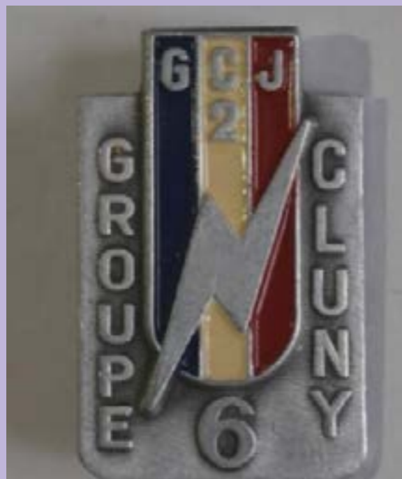
Groupement 2 Groupe 6

A ces groupes, il faut ajouter l'infirmier-hôpital qui était à Pont-du-Navoy.