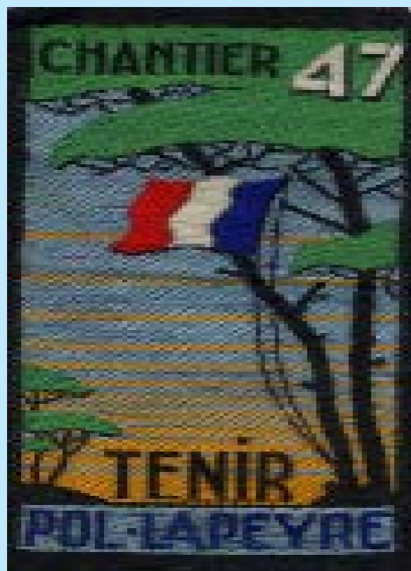
Insignes du Gt 47 variété de couleurs