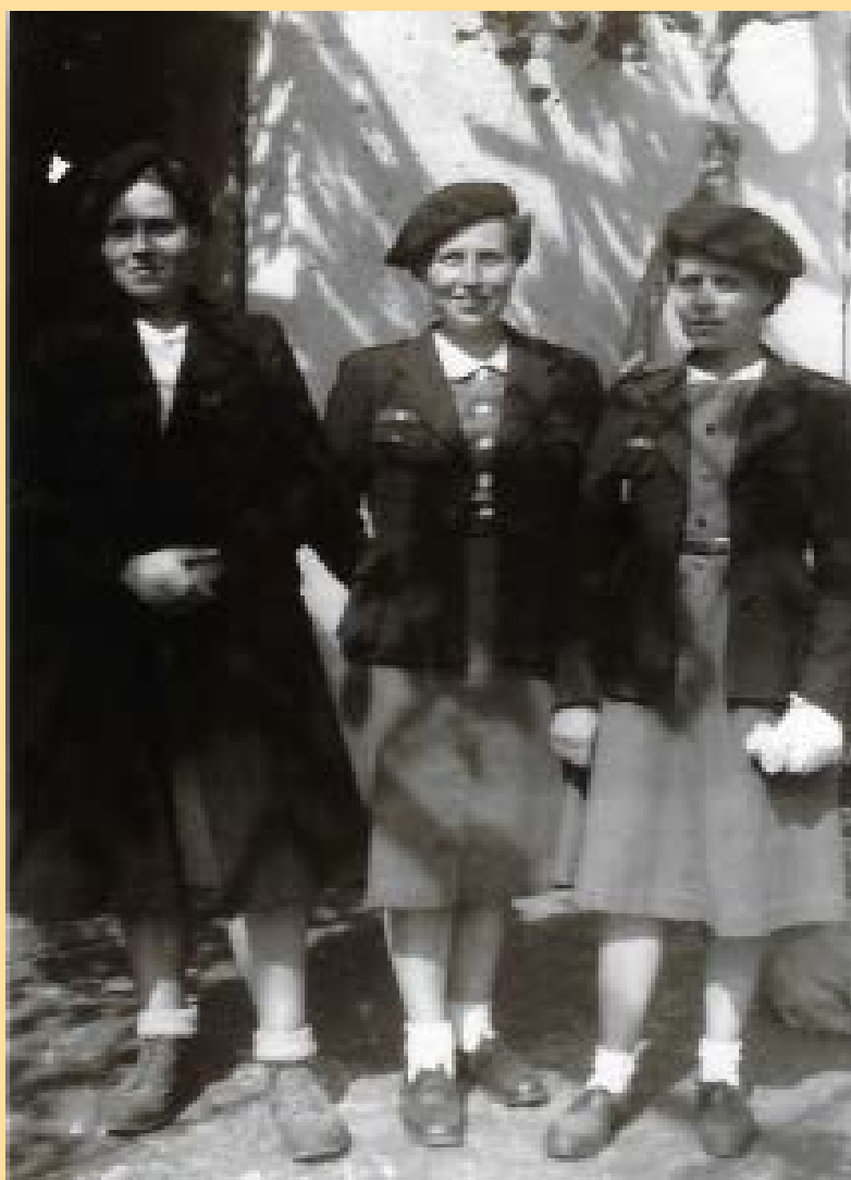
Sainte Livrade Les infirmières (1942)