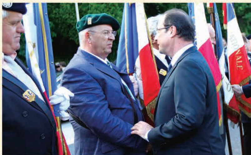
Commémoration de Tulle

Ce qui fut fait, et ce fut notre première surprise en arrivant ; il se régalait de voir notre tête lorsque l'on nous mena à cette table !!! La deuxième surprise vint plus tard ; il nous prédisait