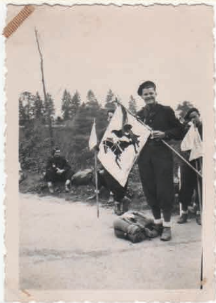
FANION DU GROUPE 6 Gt 20