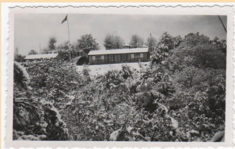
Ecole des chefs administratifs