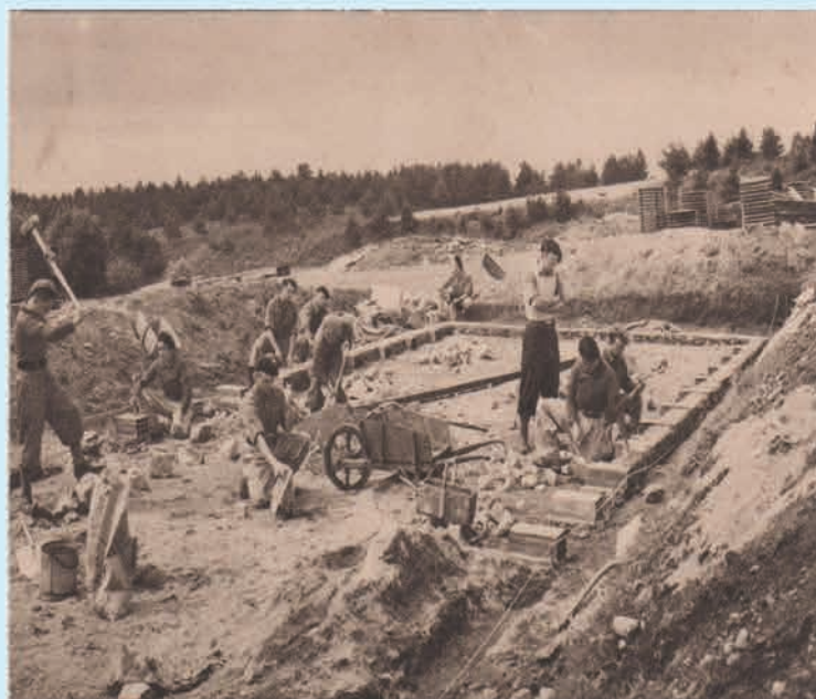
Gt 44 (Courpière) Puy-de-Dôme

*(Restaurant : 417€ - carburant : 573€ - A.G. : 987- deuil : 150€)