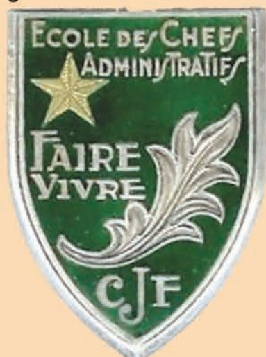
Insigne métallique de l'Ecole