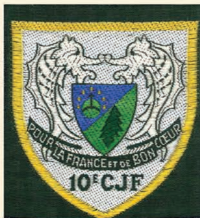
Insigne du Gt 10

Le journal Le Progrès du 20 août 2013, édition de