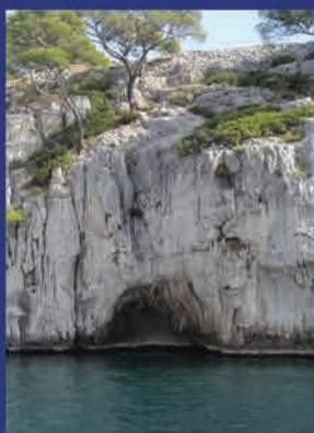
Calanques de Cassis

Ce numéro à 24 pages, pour réduire les frais d'expédition nous avons diminuer le grammage des pages intérieurs. Merci de votre compréhension.