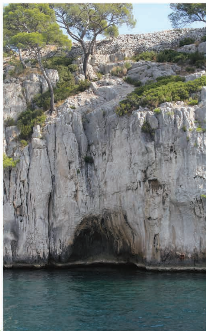
Calanques de Cassis (Bouches-du-Rhône)